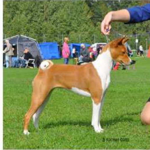
Lexi i trav och stående

De vuxna hundarna vi hade med oss föll inte riktigt domaren i smaken. De skötte sig dock fint och gjorde vad de kunde för att visa sig till sin fördel. Bäst gick det för "Daisy", SE FI Ch Jo Coyote's Ox-Eye Daisy , som vann championklassen och knep en andraplacing i bästa tik med R-CACIB. Domaren förklarade noga sitt val för mig och "Kenzo", C.I.B SE DK NO FI NORD Ch Faraoland Xcellent Example , bland hanarna och så en bild på vår svarta rörelsemaskin "Lily", Faraoland HD Street Glide .