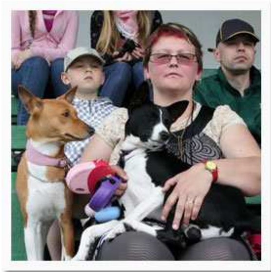
Love med sin uppfödarmatte och lekkompis.