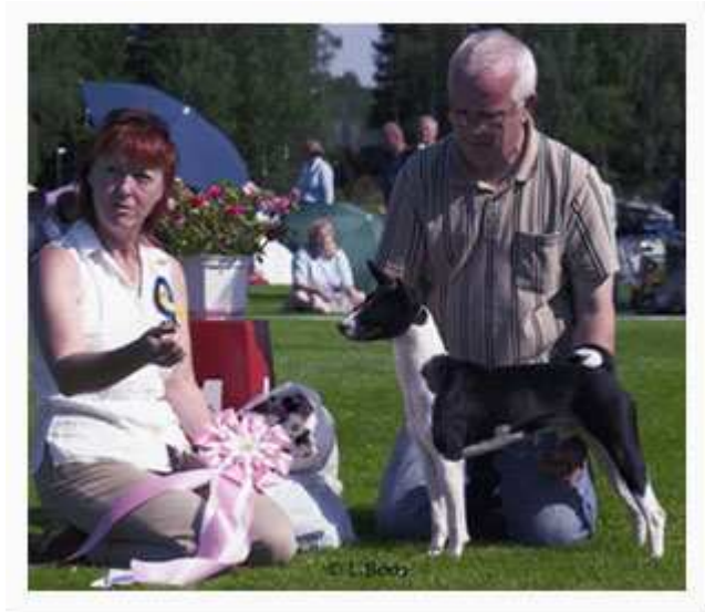
Augusti 2010 ~ SE Ch VWW-08 Faraoland Nile Wild Nimba ~