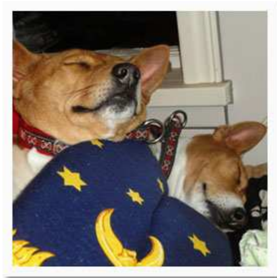
Så här trött blir man på pang

Vi var minst sagt en aning uppskruvade, så medan Missy kröp ihop i en lycklig liten hög i sängen, korkade vi upp en vinflaska. Så satt vi och filosoferade drömmande om vackra valpar ända tills vi med förfäran konstaterade att klockan hunnit bli två på natten. Förfäran eftersom vi skulle upp i ottan för att köra den långa resan hem igen. Bums i säng och lika snabbt upp ur den kändes det som. Autobahn gick smidigt med ett fåtal STAU, som inte tog timmar utan bara saktade ner farten bitvis. I Puttgarden tog vi oss tid att shoppa loss i Border shoppen som á la svenska klädjätten Ullared vräkte ut vin och sprit för löjligt låga priser.