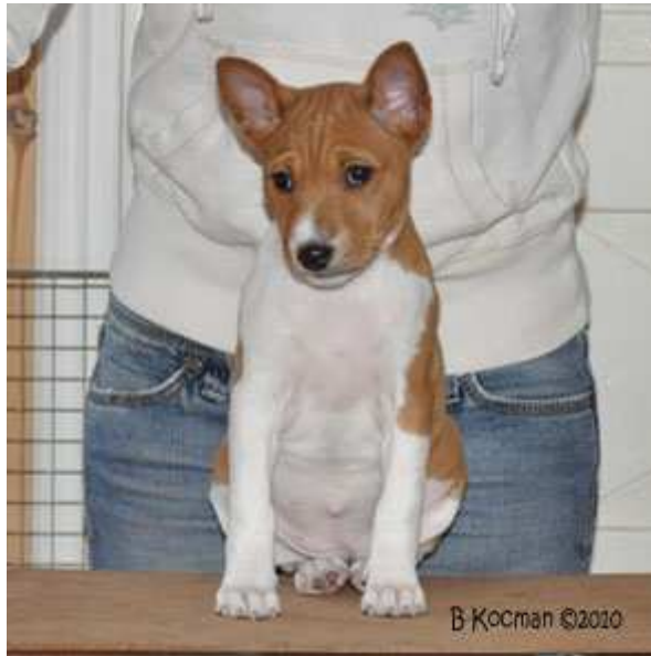
Faraoland HD Wide Glide "Chanel"