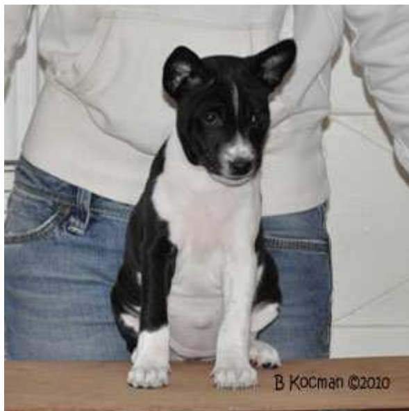
Faraoland HD Nightster "Zuki"