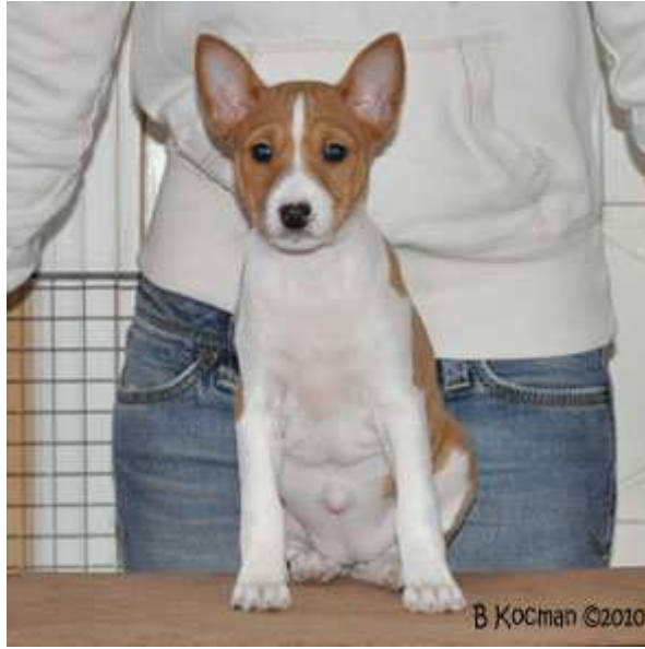
Faraoland HD Ultra Limited "Diva"