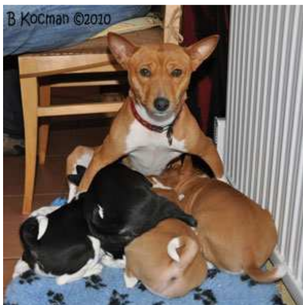
Faraoland HD Nightster Faraoland HD Ultra Limited Faraoland HD Wide Glide Faraoland HD Street Glide

Alla är utrustade med fyrbensdrift, kan fås med tvåbensdrift vid behov för att nå kakan på bänkten, acc från 0-100m på X sek, pälsen glimmar i solen, under-hållsfria i pälsen, utrustade med stabiliserade svans vid höga farter, signalhorn som överröstar det mesta vid fara eller varning, kan trimmas vid behov med gotte-chipning, utsläppen är biologiskt nedbrytbara så länge det sker i naturen, alla modeller är nedlackade, tassidorna är vita, kroppschassit kan sänkas vid jakt o bus, passar såväl i stads- som i landsmiljö, originalmodellen är utvecklad i mörkaste Afrika, flyter gärna runt i flock men kan alldeles utmärkt glida själva, mycket flexibla.