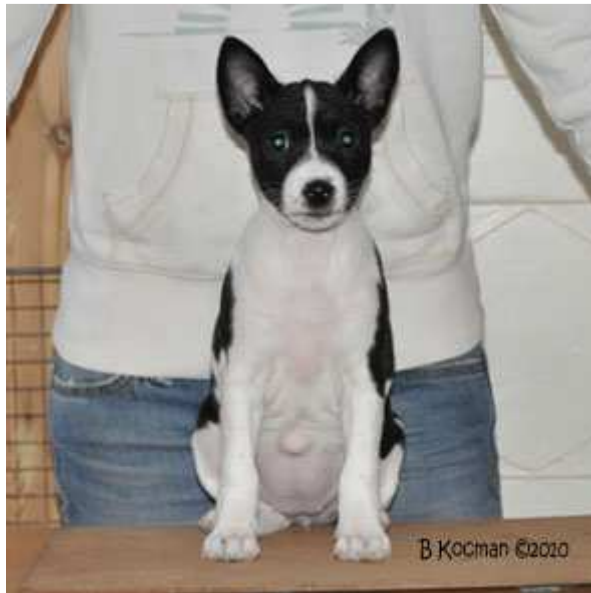
Faraoland HD Street Glide "Lily"